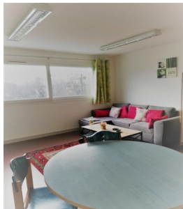
Salon d'accueil famille

Vous pouvez recevoir votre courrier le temps de votre séjour.